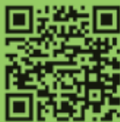
De Bonte Veer